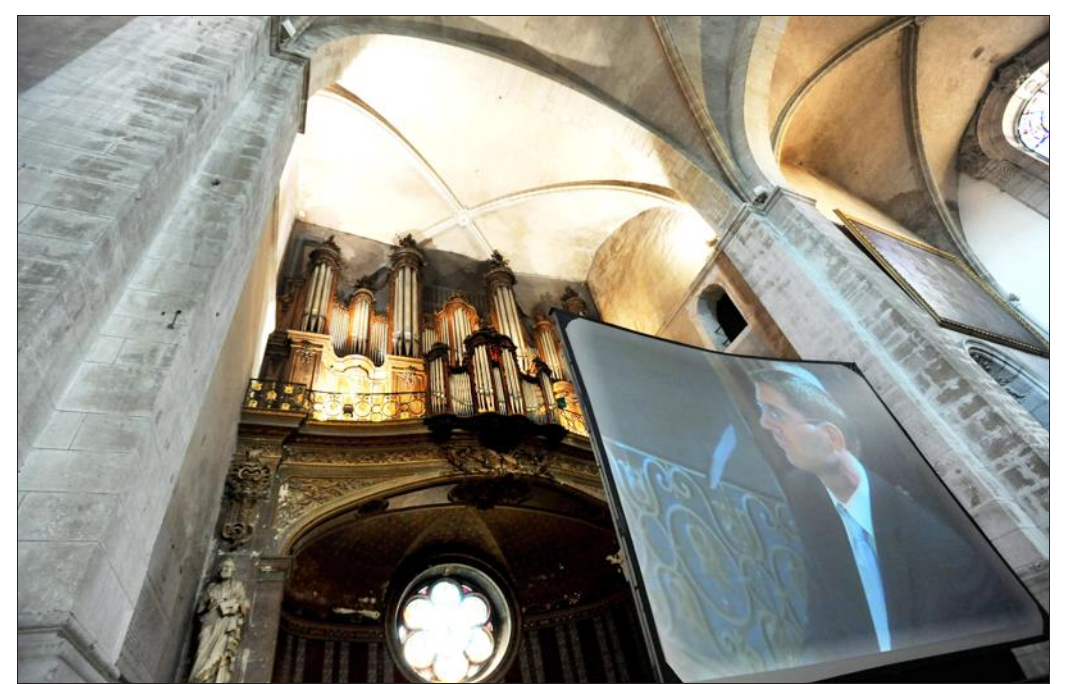
■ Un programme qui a mis en valeur les qualités de l'orgue de Notre-Dame.