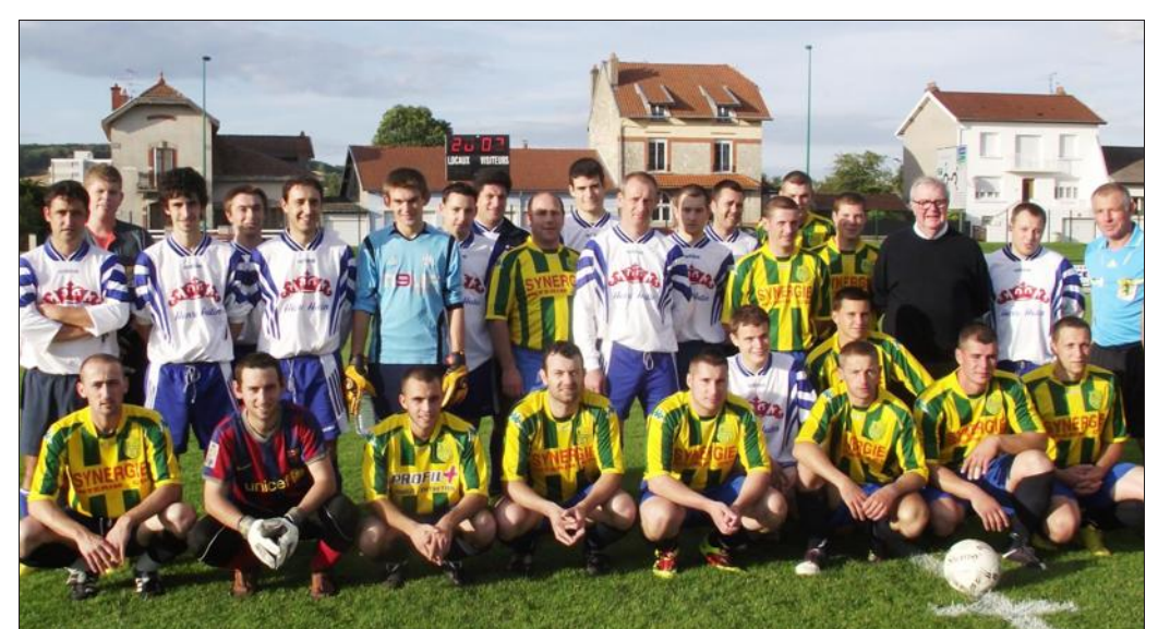
■ L'AS Hutin (en blanc) vainqueur aux dépens de Rupt-en-Woëvre.